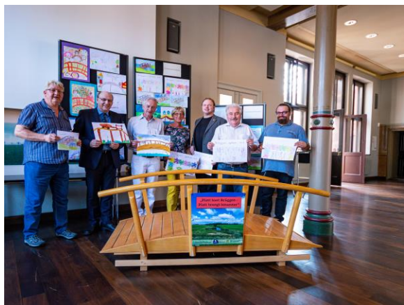
Uptaktpressekonferenz van de Plattdüütskmaant 2019 an de 26. August 2019 in Auerk

Mit en richtigen lüttjen Brügg as Symbol för dat Binannerbringen wurren denn verscheden Koppels van Lüü tohoop brocht: „Gesund un Krank“ an de 5. September in de Daagspleeg Fehnhusen, „Oostfresen un neje Nabers“ an de 25. September bi de Heimaat- un Kulturverein Haag, „Jung un Old“ bi de Kinnergaarn Vitterbuur an de 25. September. Wat daar bi rutsuert is, könen Ji hier up de Internettsied www.plattdüütsk.de sehn!